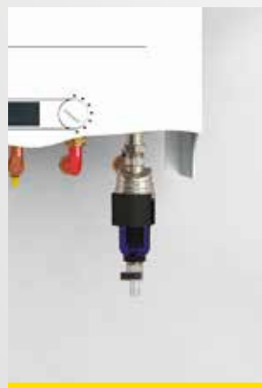
VERTICAL / VERTICALE

TM-MAG è la soluzione ottimale per la protezione della caldaia dalle impurità metalliche e non presenti nell'impianto domestico. Viene installato sul circuito di ritorno, in corrispondenza dell'ingresso della caldaia, e può essere montato anche in spazi ridotti grazie alla sua versatilità; TM-MAG può essere installato in più configurazioni senza mai perdere efficienza nell'opera di protezione della caldaia.