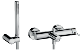
FP03 Vasca Bathtub