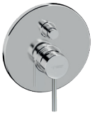
FP05 Doccia/vasca incasso deviatore 2 uscite Built-in bath/shower 2 outlets diverter