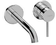
FP12 Lavabo incasso Built-in wash basin