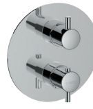
F16 Termostatico doccia/vasca incasso deviatore 3 uscite Built-in thermostatic bath/ shower 3 outlets diverter